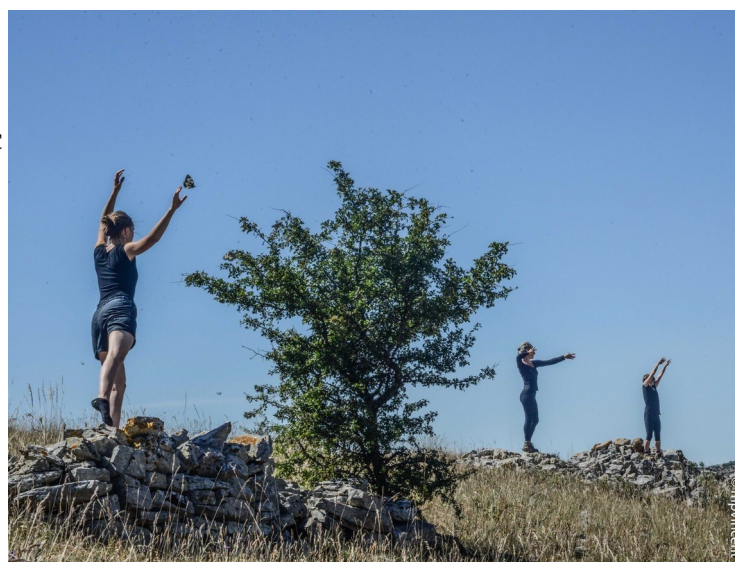
Illustration 6: sortie de résidence, danseurs sur clapas.

Je n'ai pas participé à la randonnée pour coordonner avec une aide technique. Accueil, signature droit à l'image (annexe n°9) et récolte de l'argent du public, aide à la gestion du repas, de l'eau, du déplacement de la musicienne, des navettes.