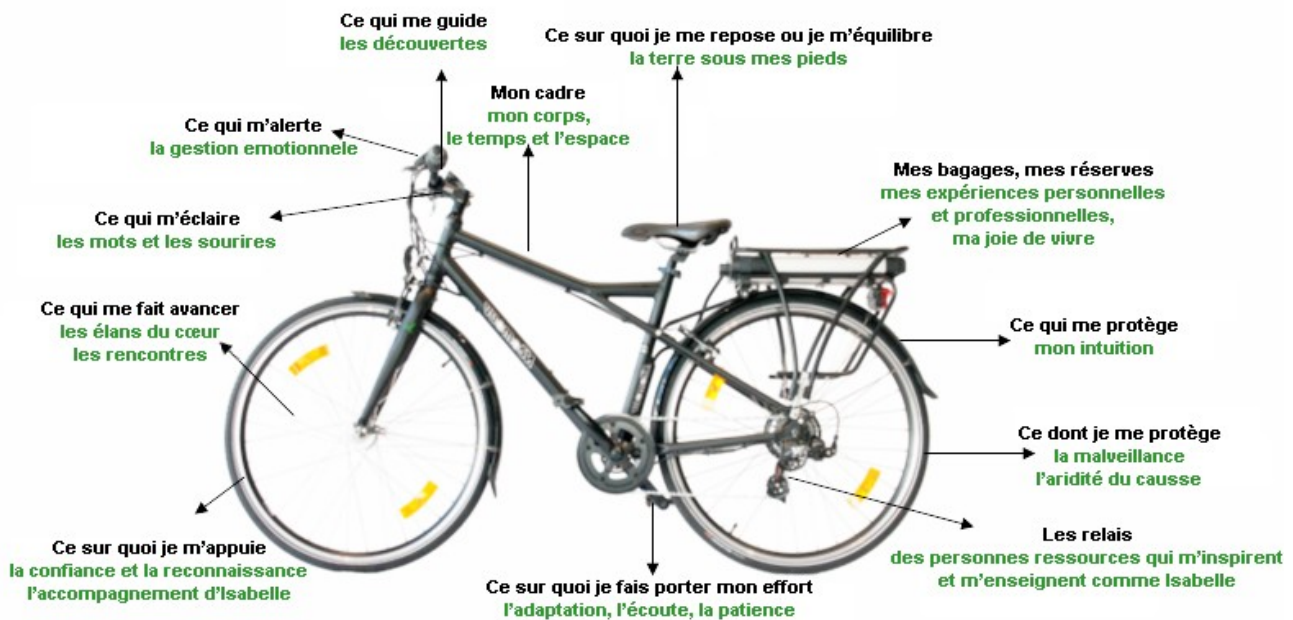
Illustration 7: outil APP Sophie Otte

Comme outil d'organisation durant ma période de stage, j'ai créé un carnet de bord de type « tableau semainier » (annexe 10) où j'indiquais de manière hebdomadaire les tâches à réaliser. Quotidiennement, je vérifiais et réajustais entre ce qui avait été prévu et ce qui avait été réalisé. Cet outil m'a très bien convenu.