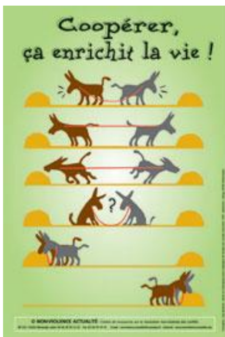
Figure 5 : La parabole des 2 ânes

D'après Jean-Michel Cornu dans son ouvrage La coopération, nouvelles approches , l'altruisme n'est pas un comportement universel : « Il est vrai que l'on pourrait imaginer une solution altruiste où chacun ferait passer l'intérêt collectif avant son intérêt personnel, mais cet espoir très souvent entendu s'est peu réalisé dans l'histoire de l'humanité. A chaque fois que l'on a cherché à imposer un comportement altruiste, cela s'est traduit par une utopie ou bien par un système répressif. » [Cornu, 2004]. Il faut donc trouver une autre démarche pour inviter les acteurs à ce mettre en coopération.