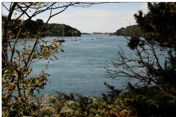
Figure 1: Vue sur l'Aber Wrac'h

Les abers sont des abris, protégés des vents dominants, constituant de véritables viviers naturels dont les hommes ont su tirer profit depuis des millénaires.