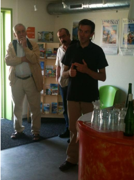
Figure 7 : Réunion de lancement du projet Abernet.