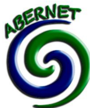
Figure 6 : Logo du projet Abernet

Afin de permettre une reconnaissance iconographique du projet et créer une identité « Abernet », un logo a été imaginé et créé. Ce logo représente la caractéristique principale du territoire des Abers qui est d'être entre terre et mer, mais aussi la coopération avec ses deux spirales bleue et verte entrelacées.