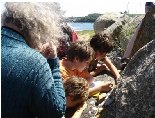
Figure 4 : Sortie nature sur les lichens