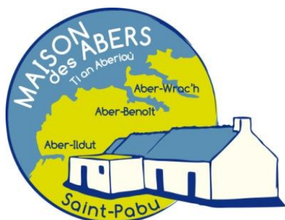
Figure 2 : Logo de La Maison des Abers

L'association « Maison des Abers–Ti an Aberioù », est une association loi 1901, créée en avril 2010 afin de faire vivre et animer une « maison de site ». Née d'une initiative municipale et de l'association Patrimoine & Environnement, accompagnée par l'Agence de Développement du Pays des Abers, elle est située sur la commune de Saint-Pabu, dans le Finistère.