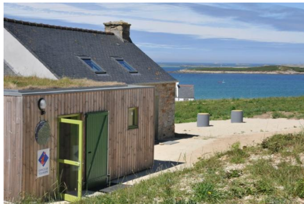
Figure 3 : Le centre d'interprétation de La Maison des Abers - Ti an Aberioù

Elle est implantée dans les bâtiments d'une ancienne ferme communale de Saint-Pabu. Outre son point de vue exceptionnel sur l'embouchure de l'Aber Benoit, la maison hérite de l'histoire d'un lieu de vie. La Maison des Abers est gérée par l'association Maison des Abers-Ti an Aberioù avec l'aide de la commune de Saint-Pabu.