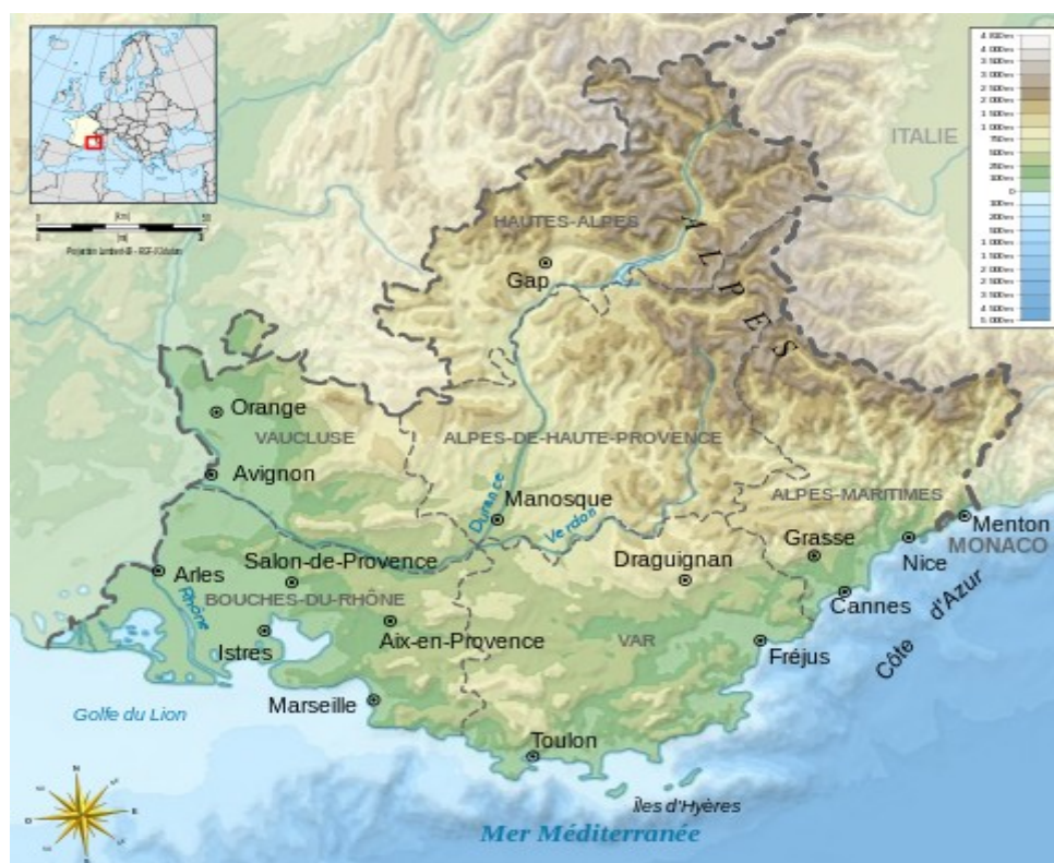
Illustration 2: Carte topographique de la région PACA.